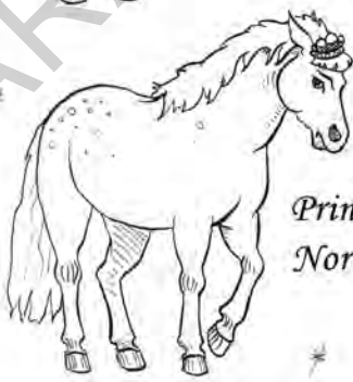
Prințesa Nor Alb